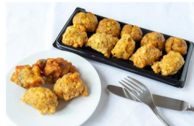
Bonbons piments aux lentilles corail 1 €