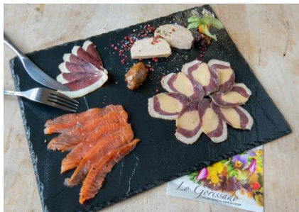
Plateau dégustation Terre et mer 14 € par personne

Saumon fumé maison, Magret de canard fumé maison, Magret de canard fourré au foie gras maison, Foie gras de canard maison, Chutney de figues