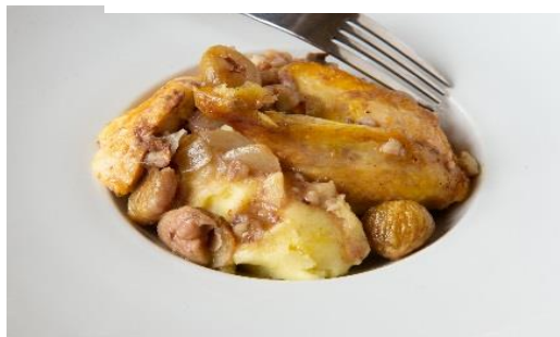
Dinde aux châtaignes, juste rôtie à l'ancienne et écrasé de pommes de terre au panais 18 € par personne