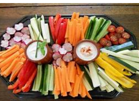
Légumes crus, fromage blanc aux herbes et anchoïade