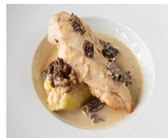
Chapon sauce morilles, poêlée de légumes et écrasé de pomme de terre 18 € par personne