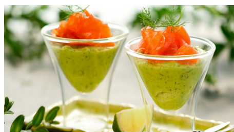
verrine guacamole aux herbes et saumon fumé 3.50 €