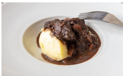
Civet de canard aux cèpes, gratin de pommes de terre et poêlée de légumes 18 € par personne