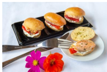
Mini navettes au saumon frais, fromage frais de vache, poivron confit, feuille de citron kaffir 3.50 €