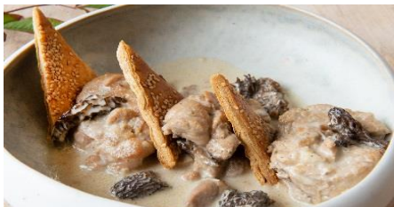
Ris de veau, armagnac et morilles, écrasé de pomme de terre et panais 18€ par personne