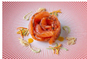
Rosace de saumon fumé maison et citronette au zeste d'agrumes 12 € par personne

Saumon fumé maison, Magret de canard fumé maison, Magret de canard fourré au foie gras maison, Foie gras de canard maison, Chutney de figues