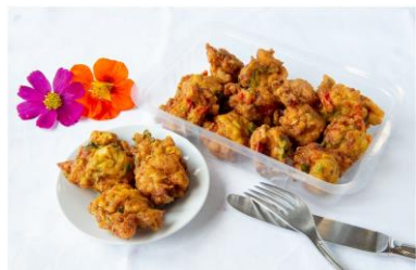
Accras de morue 1 €

"pour le repas de Noël, pensez à commander avant le 19 décembre !"