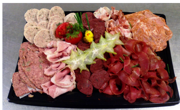
Assiette de charcuterie * Viande de grison, Rillettes de canard * Saucisson, Chorizo * Pâté de campagne * Jambon aux herbes, jambon cru 9.50€/personne