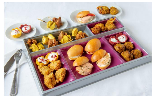
Accras de morue 1 €